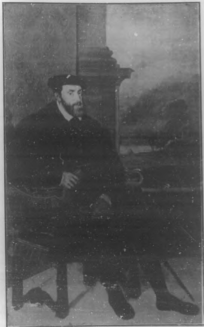
CARLOS V Célebre cuadro del Tiziano.