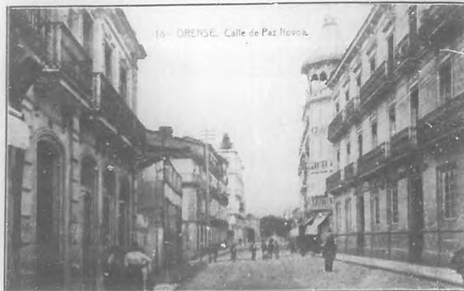
ORENSE.—Calle de Paz Novoa.

En este país es frecuente, en coplas y cantares, la exaltación de alguna cosa o cualidades privativas de un determinado pueblo, y este privilegio, que ayer más que hoy logra-