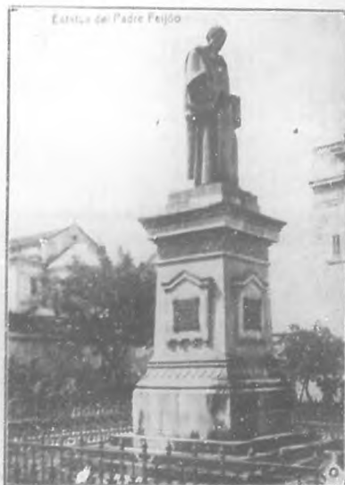
ORENSE.—Estatua del Padre Feijóo.

ba ufanar cándidamente a las gentes en cada ocasión, llega a hacerse popular y los vecinos de una y otra banda lo sacan a relucir como un valor cuando surge entre ellos alguna rivalidad. Hoy, ciertamente, ya no es un motivo de orgullo el poseer las mejores casas o alguna reliquia milagrosa de antaño. Entre las personas mayores esta costumbre, si no del todo, ha desaparecido en gran parte. Desde aquellos tiempos hasta hoy han pasado muchas cosas, y hoy sólo puede balagar a los niños una copla que ensalce las excelencias de su pueblo. Como pasatiempo infantil perdurará la costumbre en cada villa, en cada aldea y hasta en cada reunión. Los juegos de niños no se acaban nunca.