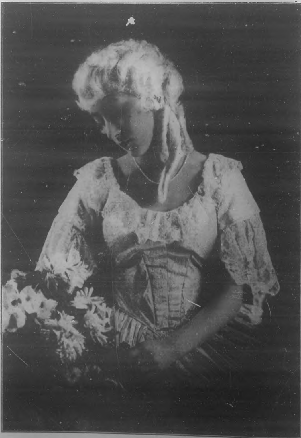
La bella y notable bailarina cubana procedente de la "Gran Opera" de París, que el próximo martes se presentará por primera vez ante el público habanero, en el "Nacional".