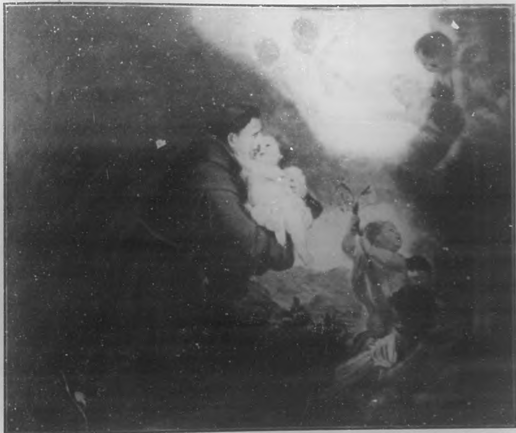
SAN ANTONIO Famosa obra de Murillo.