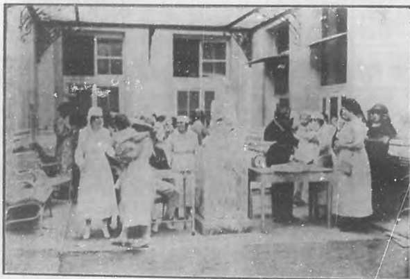
Momento en que eran examinados los niños que tomaron parte en el Concurso de Maternidad para niños pudientes.