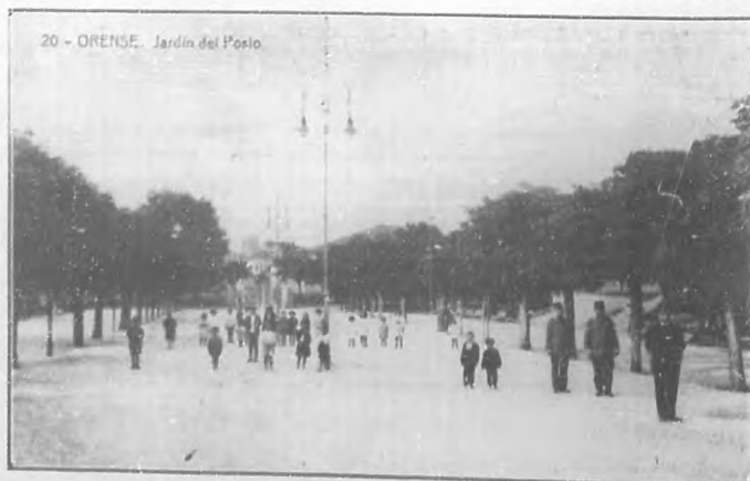
ORENSE.—Jardín del Posio.