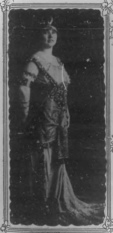
Anna Yago Contralto

Sigue cubriéndose la lista de abonados en la contaduría del teatro Payret para la gran temporada lírica que empezará en el citado coliseo el martes 26 del próximo mes de diciembre.