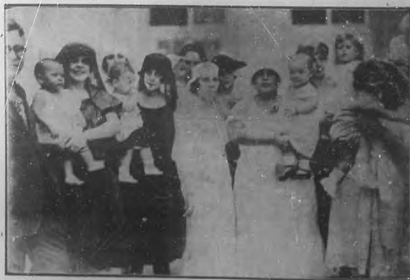
Algunos de los niños que fueron presentados en el Concurso de Maternidad para niños pudientes celebrado hace pocos días.

BOHEMIA, atenta siempre a todo signo de progreso de la República, se complace en felicitar a ese funcionario modelo, amigo querido de esta